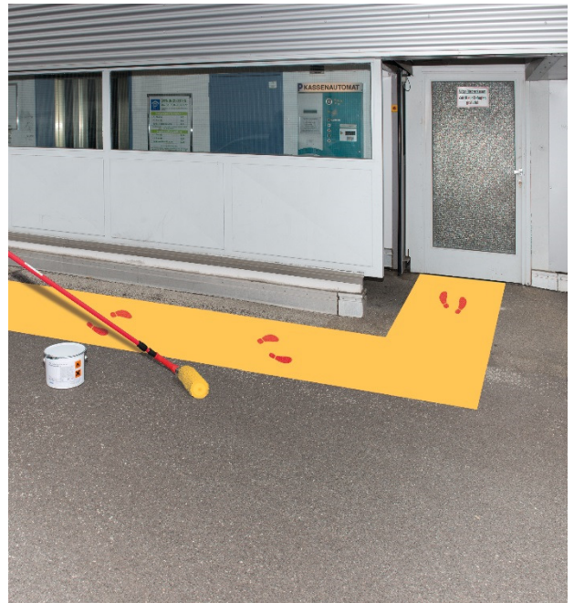
Gelb – ähnlich RAL1023