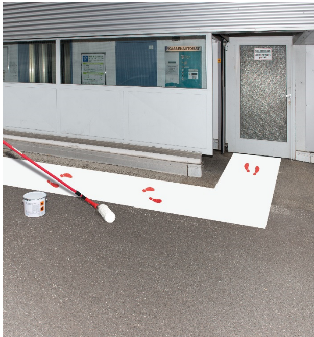
Weiss – ähnlich RAL9016