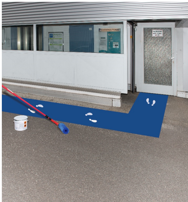
Blau – ähnlich RAL5017