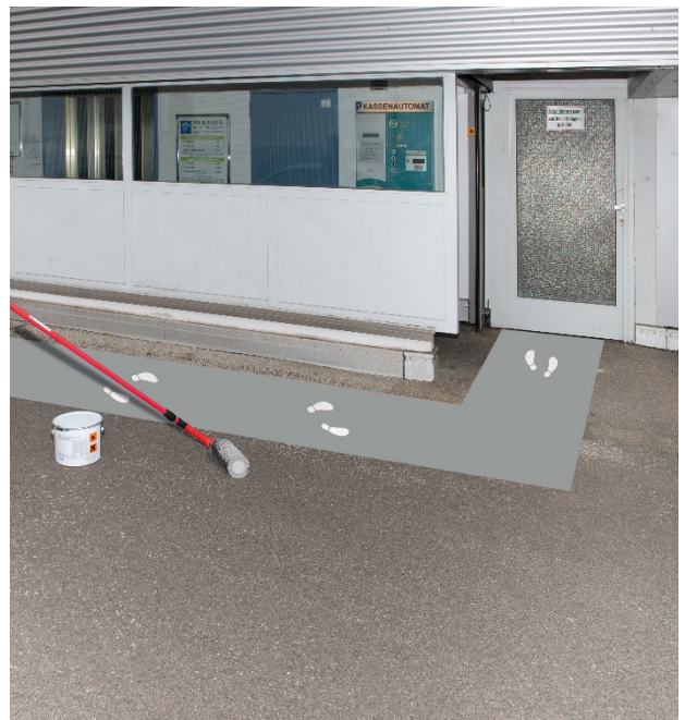
Grau – ähnlich RAL7043